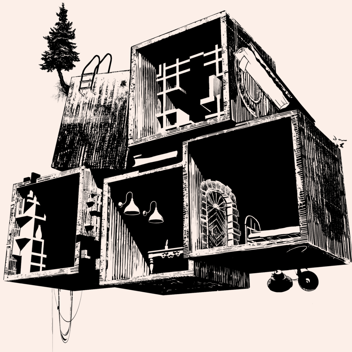
Illustration et logo : Thomas Crausaz